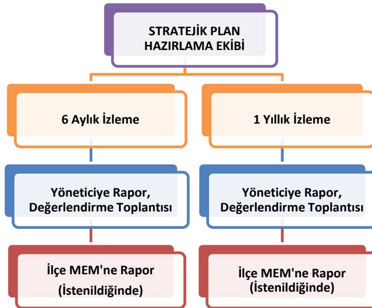
Şekil 2 İzleme ve Değerlendirme Süreci

Müdürlüğümüzün 2019-2023 Stratejik Planı İzleme ve Değerlendirme sürecini ifade eden İzleme ve Değerlendirme Modeli hazırlanmıştır. Okulumuzun Stratejik Plan İzleme-Değerlendirme çalışmaları eğitim-öğretim yılı çalışma takvimi de dikkate alınarak 6 aylık ve 1 yıllık sürelerde gerçekleştirilecektir. 6 aylık sürelerde Okul Müdürüne rapor hazırlanacak ve değerlendirme toplantısı düzenlenecektir. İzleme-değerlendirme raporu, istenildiğinde İlçe Millî Eğitim Müdürlüğüne gönderilecektir.